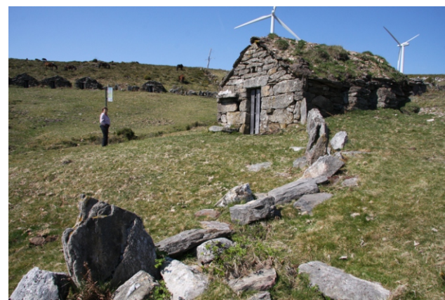
Chozos de Mangoeiros