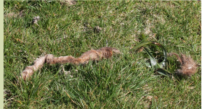
O lobo é raro de ver pero pódense atopar os seus rastros