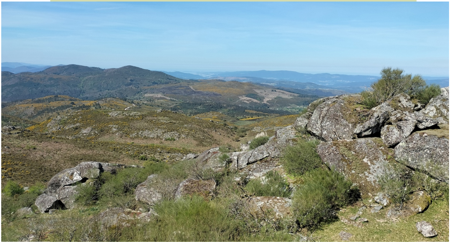
Vista cara ao oeste desde o cume do bidueiros