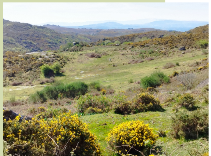
Chan do Bidueiros nas nacentes do rego de Piñeiro