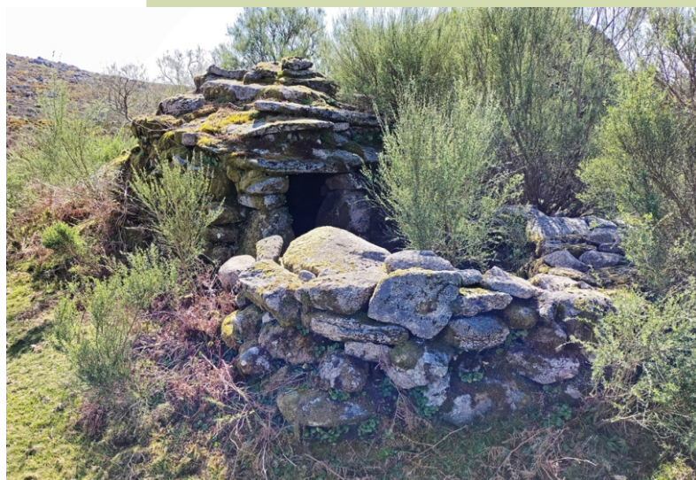
Chozo no Chan do Bidueiros