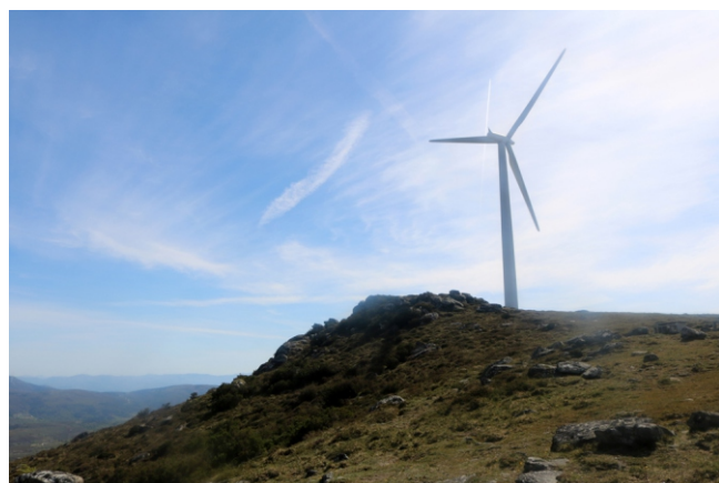
Laxa dos Números (1051 m)