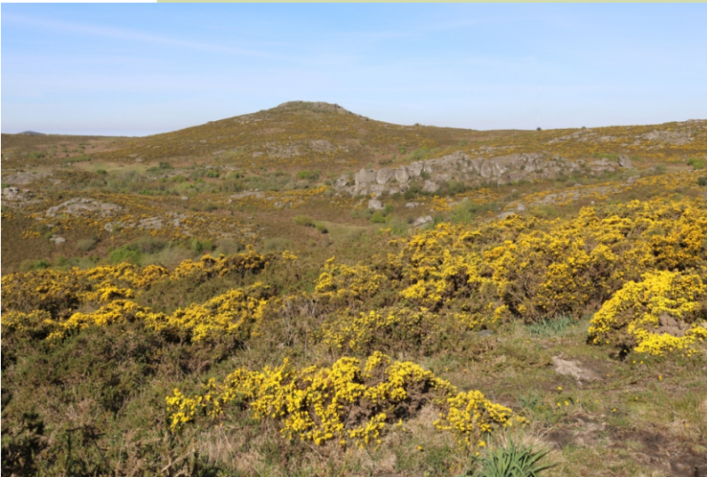
Bidueiros (943 m)