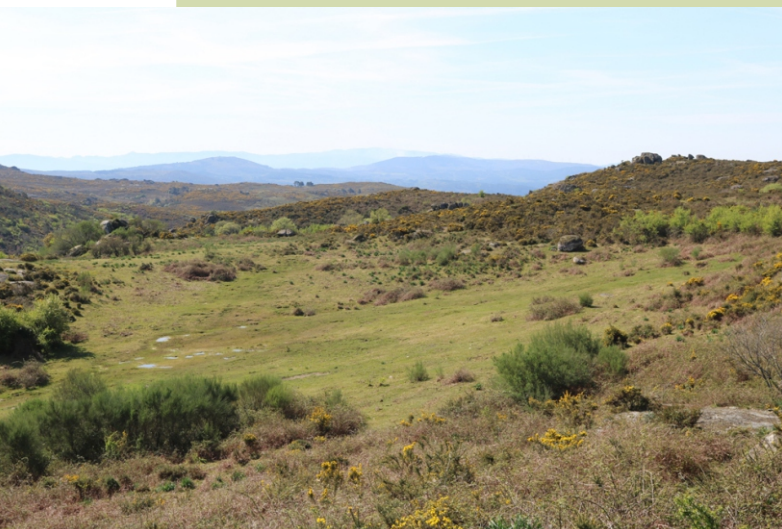
Chan de Bidueiros