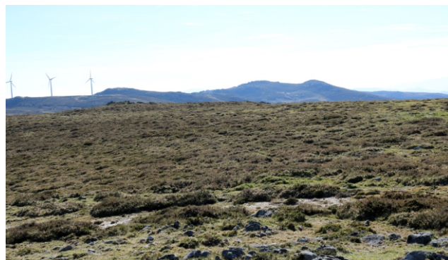
Cumes do Suido desde o Puza; á dereita o Coto dos Xarotos

O percorrido lineal entre o cumo do Puza e o cumo da Pedra Partida é duns 17 km, mais pódense aforrar uns quilómetros facendo en coche, coas paradas que se considere, os tramos de asfalto e o percorrido polas pistas dos parques eólicos.