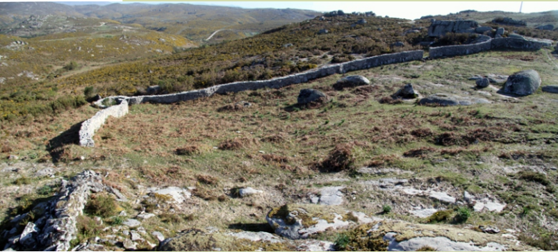
Foxo do lobo de Pigarzos