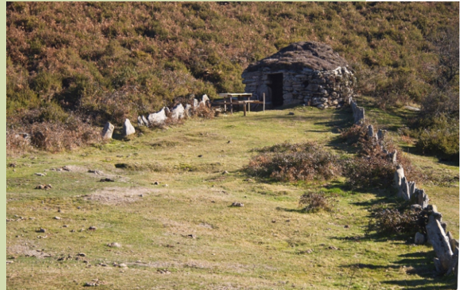
Chozo en Portela das Travesas