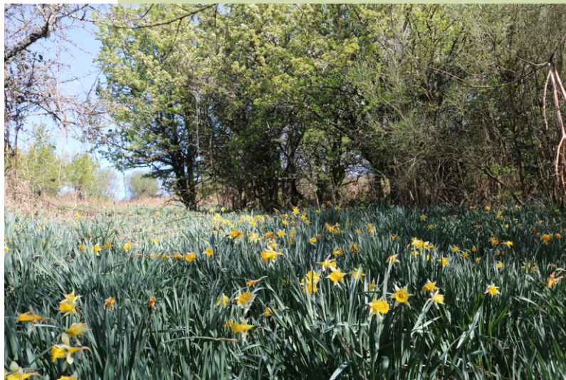
Campo de Narcissus pseudonarcisus