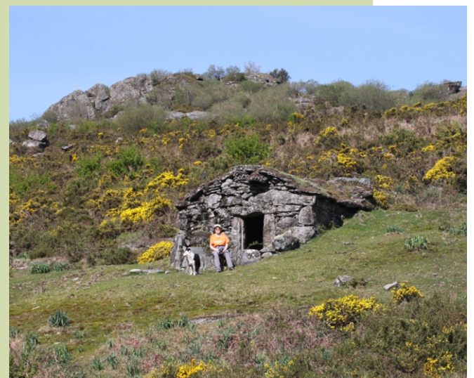
Chozo de Bidueiros