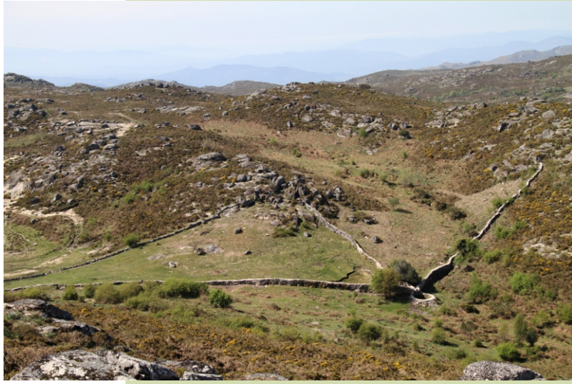
Foxo do lobo de Portela das Travesas