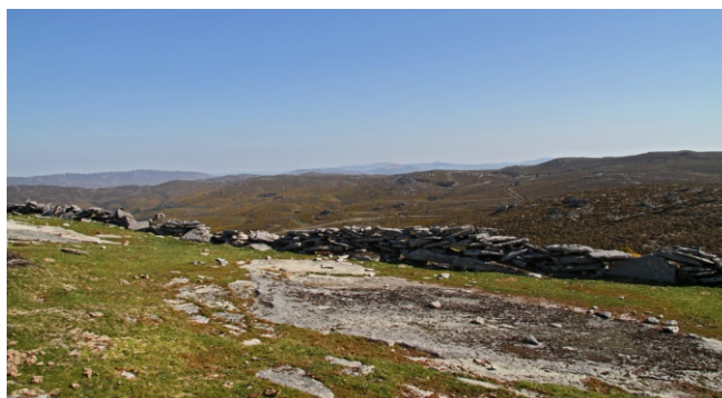
Curral no cumo do Coto dos Xarotos