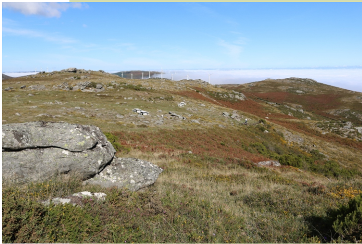
Coto Miñoto desde a Laxa dos Números. Por debaixo da área de lecer que hai entre o Coto Miñoto e a Laxa dos Números, podemos ver a casa de San Bernabé