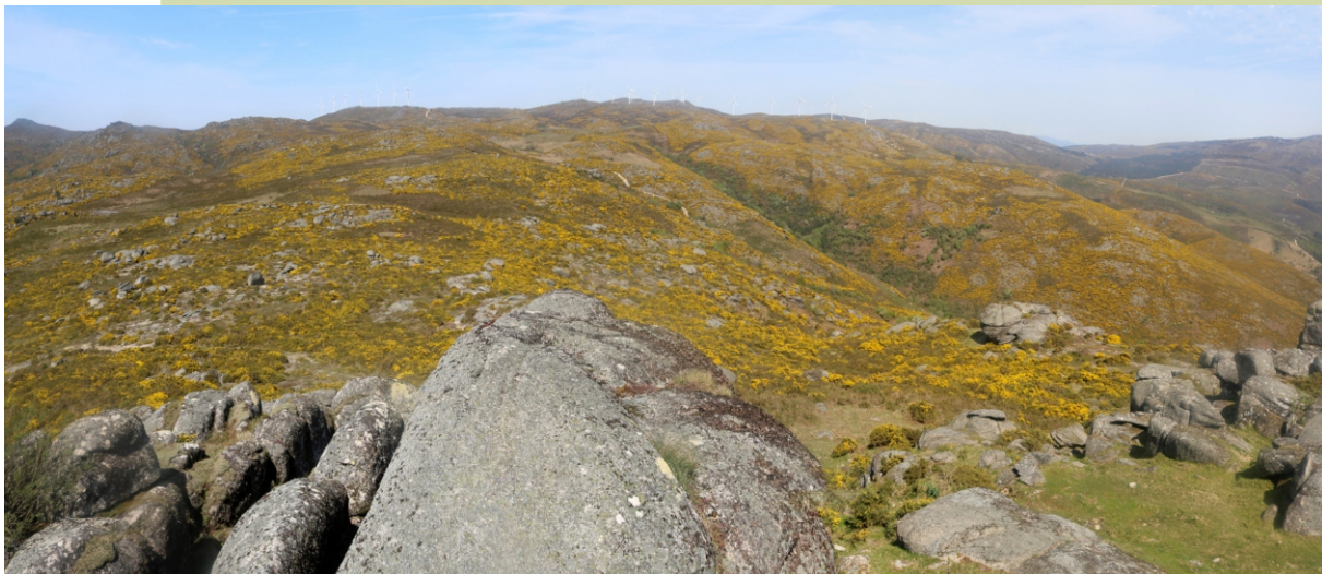
Vista da serra desde Pena Partida