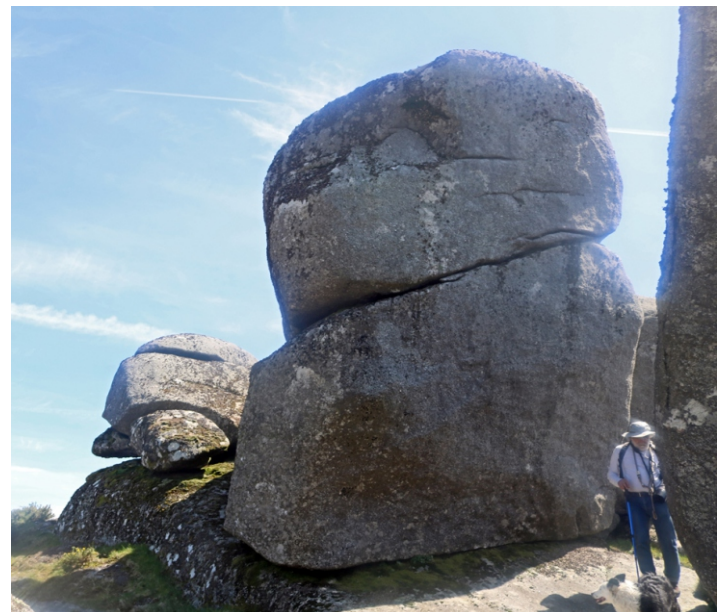
Penedos no cume da Pena Partida

Na serra do Suído podemos atopar catro especies de amareles: Narcissus bulbocodium , N. triandrus , N. cyclamineus e N. Pseudonarcissus