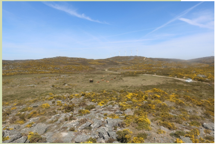
Braña no camiño das Laxilñas