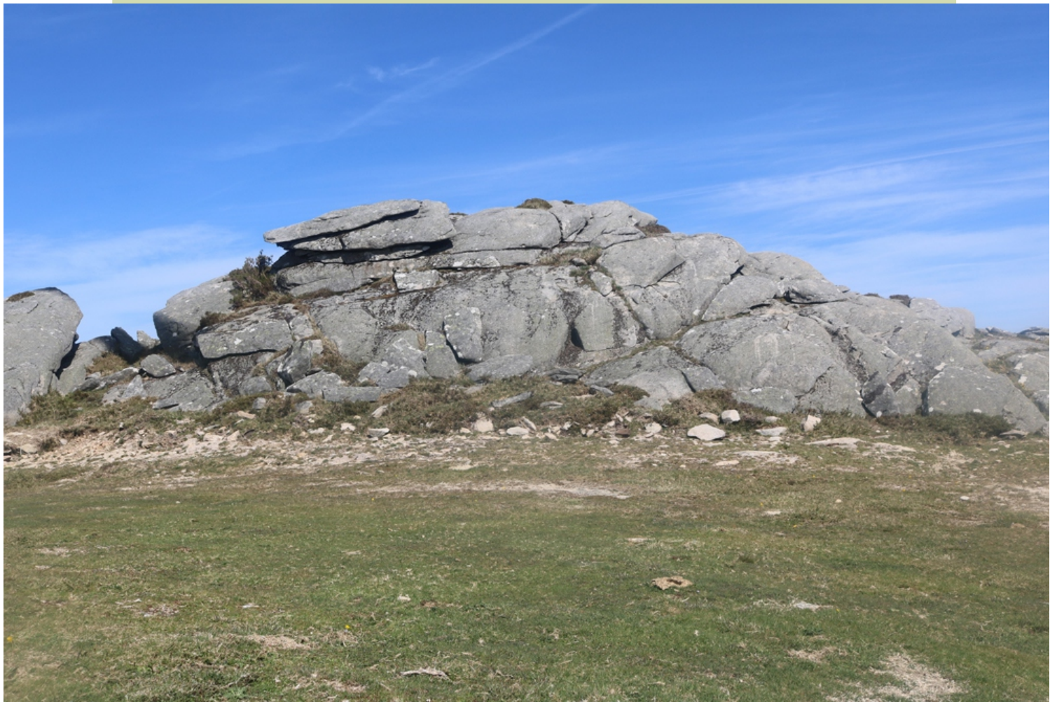
Laxa dos Números (1051 m)